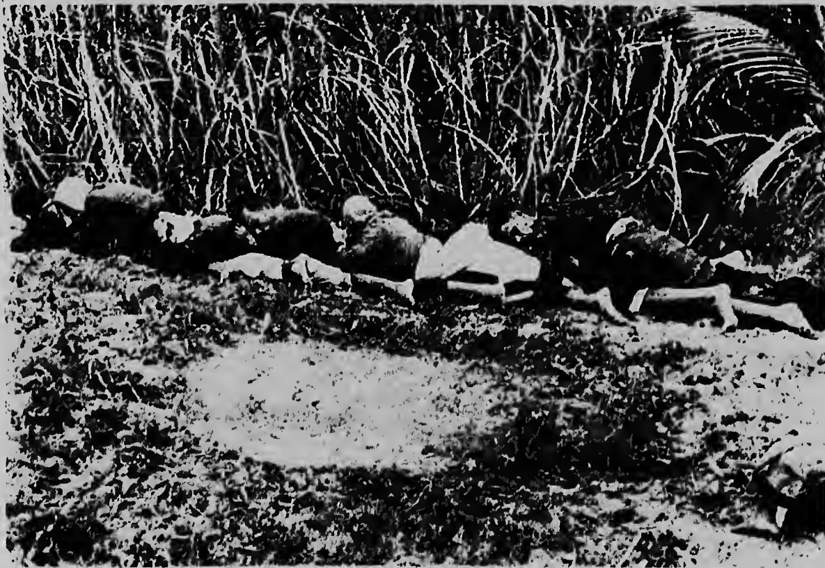
BONG SON, VIETNAM DEL SUR--Guerrilleronan di Viet Cong cu a ser captura ta drumi riba otro huntu durante un lucha entre soldanan mericano y forsanan comunista. Mas di 475 comunista a ser mata den e batalla aki.

E brug nobo, un di esnan mas largu di America Latina, lo reemplaza e empleo di flota, cu cual tabata transporta ganado na pia for di Aisen te Puerto Chacabuco.